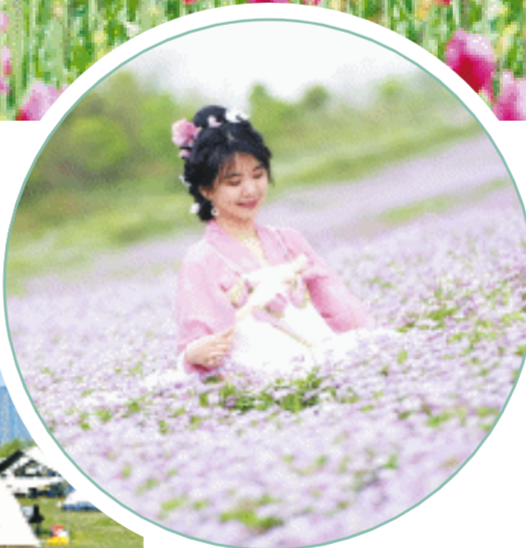
4月1日,在望城区茶亭镇苏蓼垌义渡亭,河滩上一片紫云英如梦如幻,游客被陶醉了。