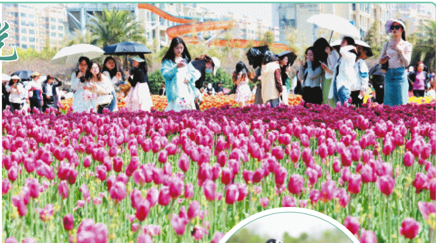
4月1日,省植物园世界名花广场。这里种植了30个品种50万株郁金香,游客置身花海之中,流连忘返。