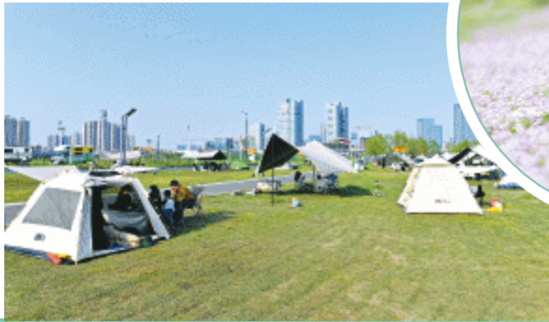
4月1日下午,马栏山嘴公园内遍布着五颜六色的帐篷,游客们纷纷来此享受阳光和野趣。