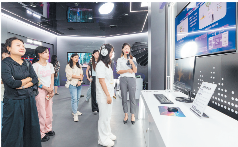
马栏山音视频实验室赋能音视频产业高质量发展。

创新破局:技术筑起“护城河” 技术创新是短剧的“护城河”,但过去很长一段时间,这条“河”是干的——翻译靠人工、审核靠堆人、制作流程割裂。 马栏山音视频实验室的一角,正在改变这一切。某热门电影的片段以不同国家语言依次播放,音色、情绪几乎无损复刻。这就是实验室自研的“智马翻译”——“1分钟视频片段,3分钟即可完成翻译,准确率超95%。”相关负责人说,现在3分钟完成的工作,以前可能需要一天。 这只是马栏山技术实力的一个切面。成立不到两年,这个省市共建的新型研发机构已提交发明专利申请200余项,参与发布团体标准13项,今年3月更获评AVS产业技术创新奖。技术不再是“配角”,而是短剧出海的“发动机”。 下转2版