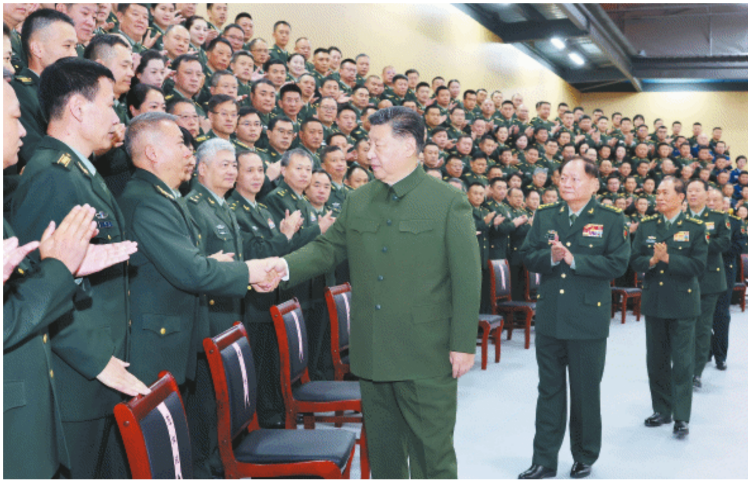
12月4日，中共中央总书记、国家主席、中央军委主席习近平视察信息支援部队，代表党中央和中央军委，对信息支援部队第一次党代表大会的召开表示热烈祝贺，向信息支援部队全体官兵致以诚挚问候。这是习近平同代表们亲切握手。